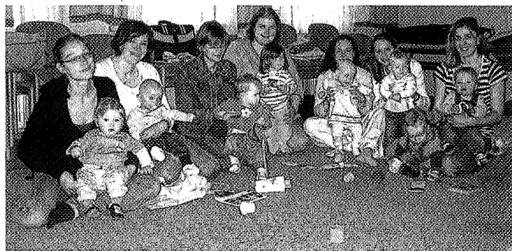
Die Miniclubs gibt es in etlichen Gemeinden des Landes. Wie hier in Gols treffen sich junge Mütter mit ihrem Nachwuchs um Erfahrungen auszutauschen.

Manche Kinder müssen sehr intensiv betreut werden. „In diesem Fall versuchen wir die Eltern natürlich zu entlasten“, erzählt die Kinderkrankenschwester. „Meist sind wir dann auf der Suche nach Sponsoring, damit die Eltern sich den Selbstbehalt leisten können. Natürlich sind wir auch so immer auf der Suche nach Sponsoren, die eine regionale Non-Profit-Organisation unterstützen wollen. Wir sind wirklich zu 100 % für die Eltern und die Kinder da. Vielleicht findet sich ja auf diesen Wege jemand, der uns sponsern würde.“ Mehr Informationen über den Verein auf www.moki.at .